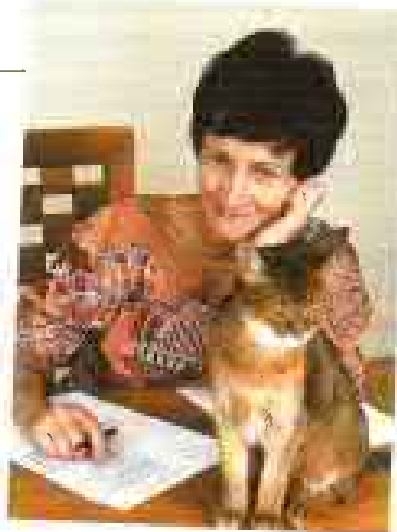
Claude Pujade-Renaud, « Le café d'en face », Vous êtes toute seule ? Actes Sud.

Le patron repasse, le patron est derrière le comptoir : - Tiens, la petite maigre est revenue ! La femme du patron jette un coup d'œil par-dessus son fer : - Non, c'est pas elle. Elle s'est mise à la même place mais celle-là, elle est un peu plus forte. Ce qui trompe c'est qu'elle a les mêmes yeux. - Tu as raison, c'est pas elle mais c'est cette façon de regarder sans regarder. Le patron rince un verre, l'essuie : - C'est bizarre, c'est comme si quelque chose se répétait. La femme du patron appuie pensivement sur son fer : - Oui, ça se répète. Francine vide sa tasse, paie, traverse.