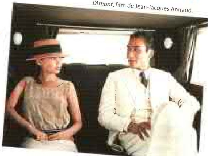
L'Amant, film de Jean-Jacques Annaud.