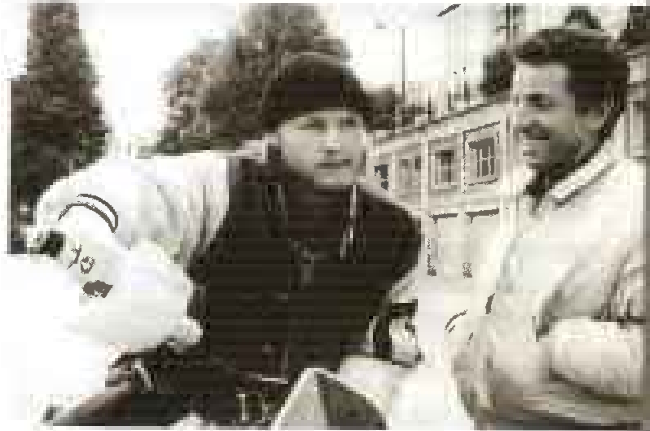
Court métrage d'Alexandre Mehring.