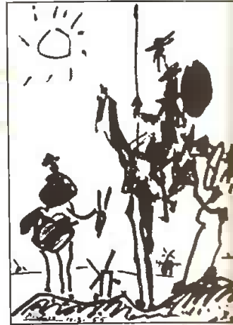
Don Quichotte et Sancho Pança. Picasso. 1955.