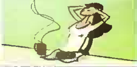
eine Pause machen