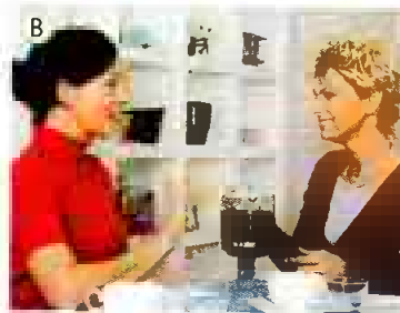
Kaffee? – Nein, _____.