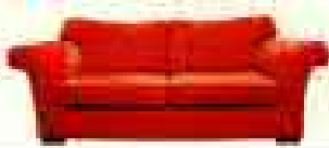
● Sofa / ● Couch