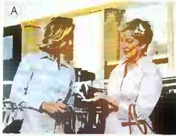
Brauchen Sie Hilfe? – Ja, bitte .