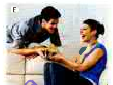
Vielen Dank! – _____.