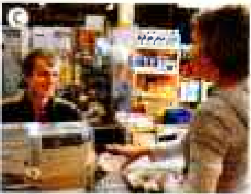
Das macht dann 9 Euro 95, _____.